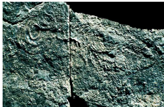
Charnia et Charnodiscus. Ediacara, Pound Quartzite, Australie du Sud, localité où ont été découverts les premiers "animaux corps mous" (560 Ma).

Le "clou d'or" (GPPS) de la limite Précambrien – Cambrien est officiellement planté dans la Formation de Chapel Island dans la Péninsule de Burin (Terre Neuve), à la première apparition de l'ichnoespèce (trace fossile) Trichophycus (ex Phycodes ) pedum , soit un âge géochronologique un peu plus ancien que -530 Ma obtenu au milieu de la zone cambrienne à Rusophycus .